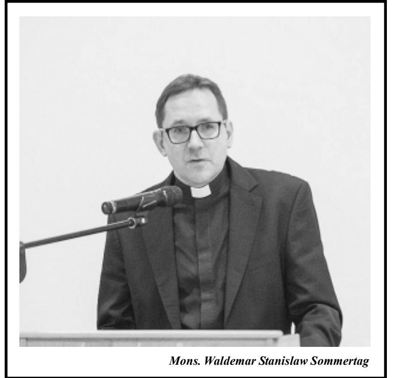
Mons. Waldemar Stanislaw Sommertag

En este contexto, el Nuncio Apostólico había jugado desde 2018 un rol de mediador en diversas instancias de diálogo entre los diversos actores involucrados en el conflicto nacional. Sin embargo, las tratativas no prosperaron y las tensiones siguieron escalando, especialmente las desavenencias con el gobierno de Ortega, quien ostenta el poder desde 2007, y