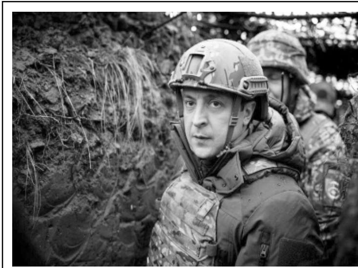
Volodymyr Zelenskyy, Presidente de Ucrania

Ucrania ya experimentó en 2014-2015, el desmembramiento de parte de su territorio con la toma de Crimea, y el nacimiento de grupos pro rusos en la región de Donbas donde se levantaron en armas los bastiones de Donetsk y Lugansk abiertamente contra el gobierno legítimo y democrático de Ucrania, con la ayuda por supuesto del gobierno comunista y expansionista de la Rusia de Putin, que seis o siete años después le han servido de justificación al perverso Putin, para escalar el frente de guerra a su estado actual.