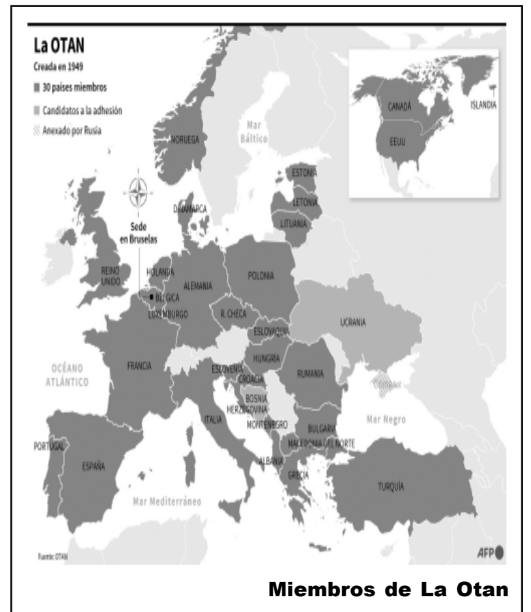
Miembros de La Otan

No negamos que tanto la OTAN, como la UE, EE.UU, Gran Bretaña, han tomado medidas que si bien son fuertes y eficaces en el campo económico, tratando de ahogar la economía rusa con sanciones de todo tipo entre las que mayor daño le están causando a Rusia, está el cierre del espacio aéreo europeo, no permitirle el uso del Swift, paralizarle la venta de petróleo y gas, sanciones a la oligarquía que rodea a Putin y al mismísimo Putin, e incluso la última tomada como es la cancelación del uso de las tarjetas de crédito Visa y MasterCard, que sin duda le rompen el esquema de dominación y su ego personal a quien siendo quien está sancionado y a saber cuantos millones que pueda tener fuera de Rusia, le hayan podido ser confiscados al igual que a su círculo de allegados y