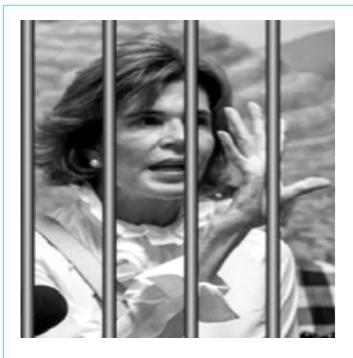
Christiana Chamorro quiso ser presidenta.