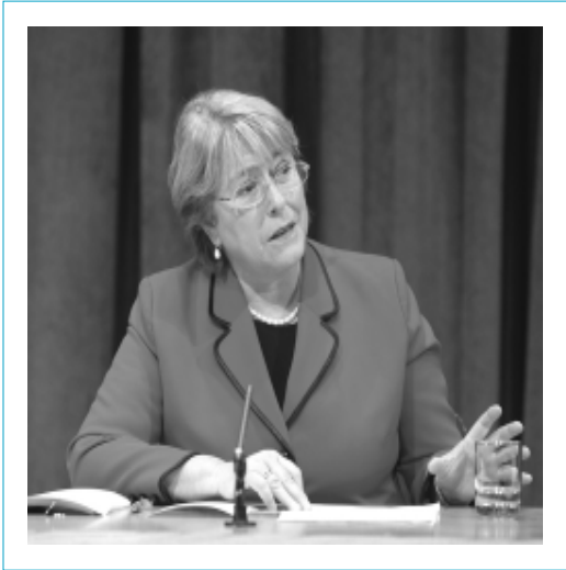
Michelle Bachelet, Derechos Humanos ONU