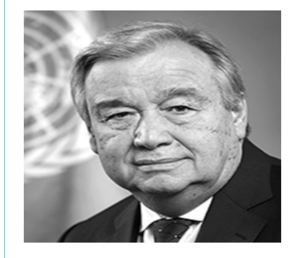
António Guterres, Secretario Naciones Unidas