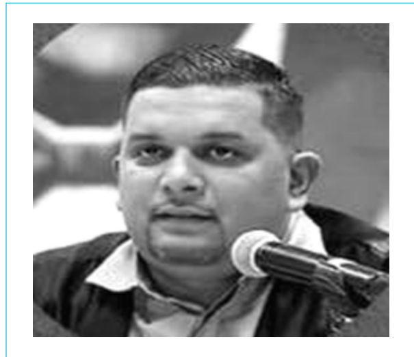
Félix Salmeron verdugo sandinista.