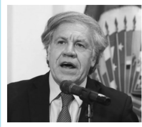
Luis Almagro, Secretario OEA aliado de Ortega