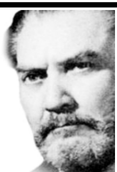
Salomón de la Selva