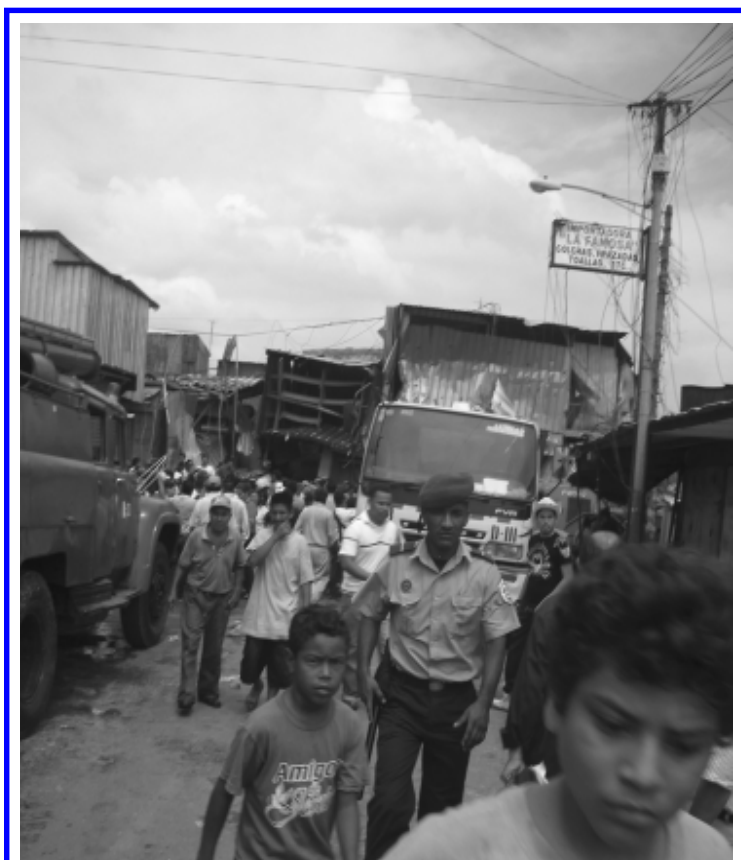
Después del incendio que arrasó con 4 manzanas del mercado Oriental, mucha gente se lanzó sobre los escombros, a ver qué le tocaba.