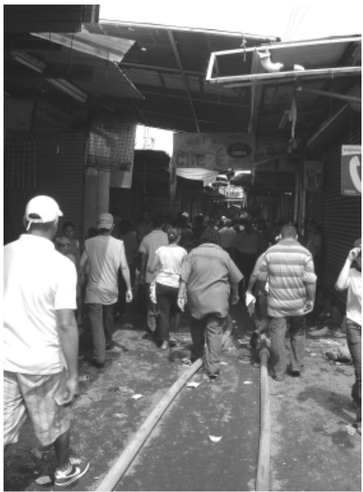
La foto deja al descubierto a los "chatarreros", que hicieron su agosto, recogiendo escombros, mientras la policía retenía a los verdaderos dueños de los tramos siniestrados.