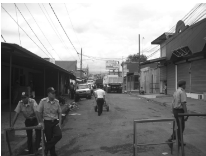
Posiblemente la policía fue sorprendida por los "chatarreros" que se hicieron pasar como los dueños de los negocios quemados, en el mercado Oriental.