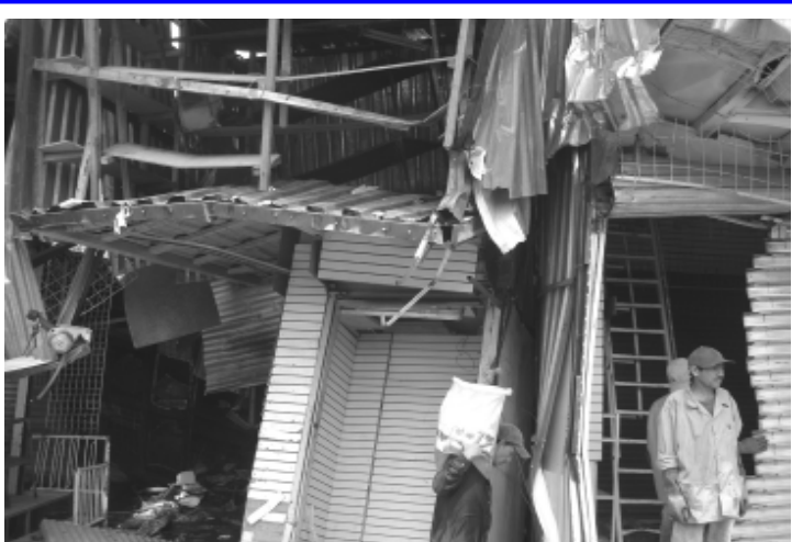
Algunos dueños de tramos, lograron rebasar el cerco tendido por la policía, para proteger los escombros de lo que fueron sus negocios