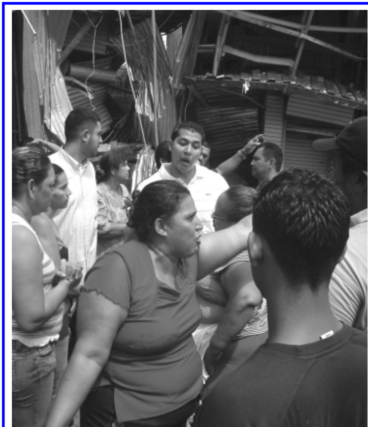
Esta airada señora, protesta ante las autoridades del mercado Oriental. Al llegar a su negocio, no encontró nada, otros habían vendido el zinc, hierro y los perlines quemados de lo que fue su negocio.