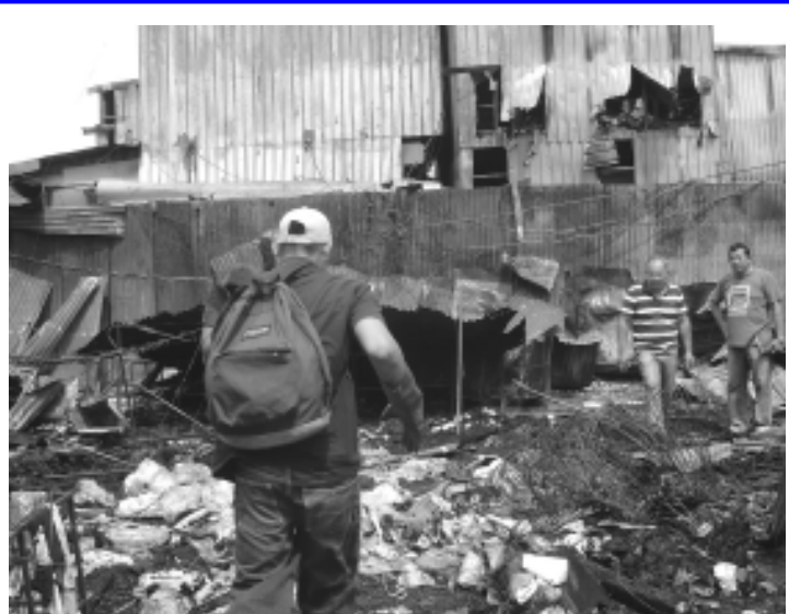
Mientras agentes de seguros, analizaban, las consecuencias del siniestro, otros hurgaban, en busca de algún souvenir del incendio.