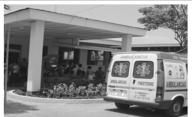
A pesar del paro médico, la atención en los hospitales de Managua estuvo normal. Los galenos reclaman aumento de sueldo del 46 por ciento