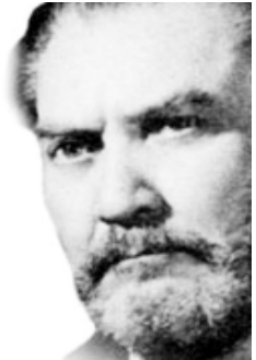
Salomón de la Selva