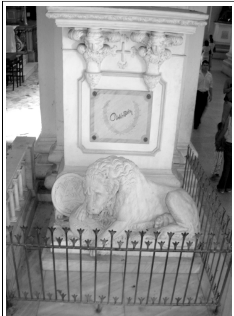
Tumba de Rubén Darío - Catedral de León, Nicaragua

NO GRITEN NI CAUSEN ALBOROTO. EI LEON QUE CUIDA SU TUMBA ESTA INQUIETO PORQUE RUBÉN SE PUEDE DESPERTAR. SILENCIO, APÁRTENSE, DEJEN DORMIR AL PRINCIPE DE LAS LETRAS CASTELLANAS.