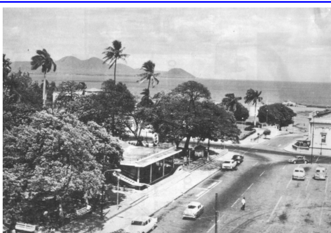
Vista parcial de Managua - pre terremoto del 1972