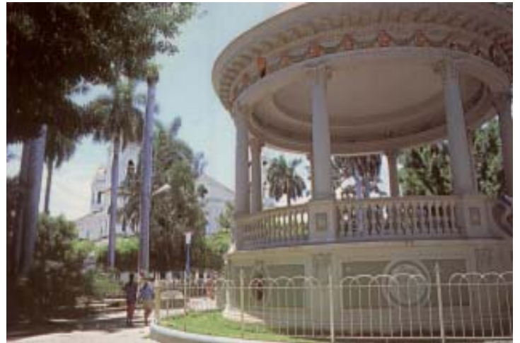
Parque Central (Granada)

El espectáculo de las isletas es único en el mundo. Son 523 y en cada una, entre arboledas