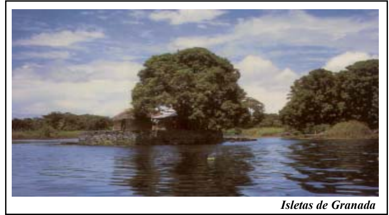
Isletas de Granada

Fue existiendo, viviendo poco a poco Nicaragua, fijándose moldes definitivos, amor a la propiedad, cultivo del suelo, cultura del hombre, la mujer tratada como compañera dada