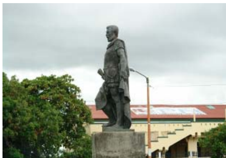
Escultura de Francisco Hernández de Córdoba, frente al Lago de Nicaragua en Granada

La fundación de estas primeras ciudades implicó, el nombramiento de las primeras autoridades, cuya responsabilidad fue llevar a cabo la conquista definitiva del territorio; los mecanismos de autoridad fueron, la Iglesia, el militarismo y las dependencias administrativas.